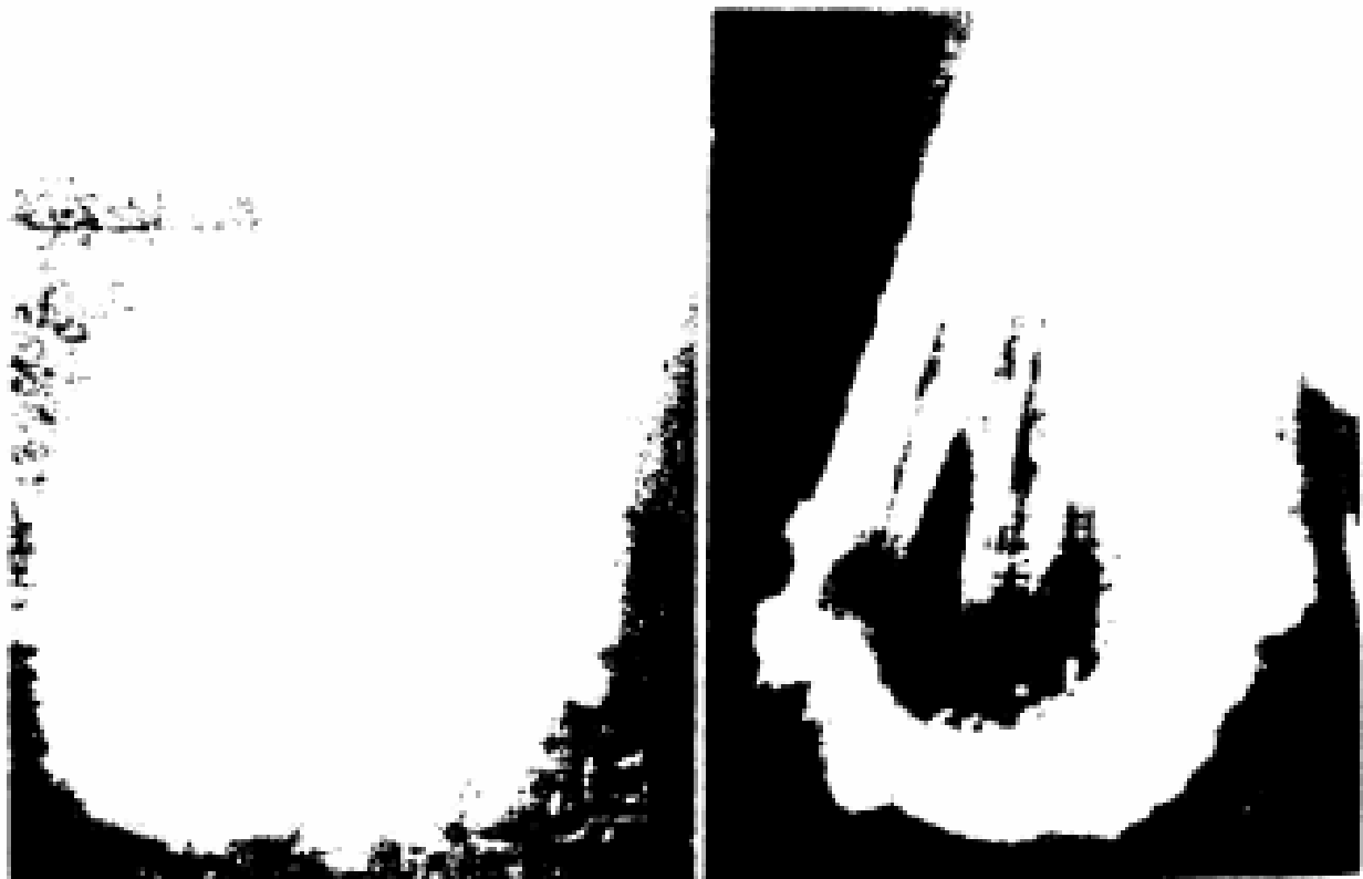
خلية دم تتأثر بآيات القرآن ويتغير المجال الكهروطيسي حولها، وعند ذبذبات محددة تنشط هذه الخلية