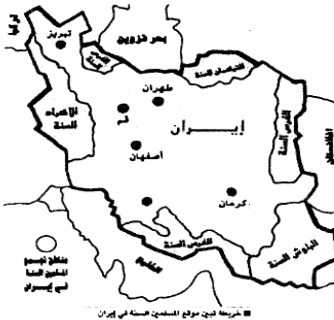
خريطة تبين موقع المسلمين السنة في إيران

واليوم نسمع من حكام إيران وعلمائهم الكلام عن حرية أهل السنة بإيران في ممارسة