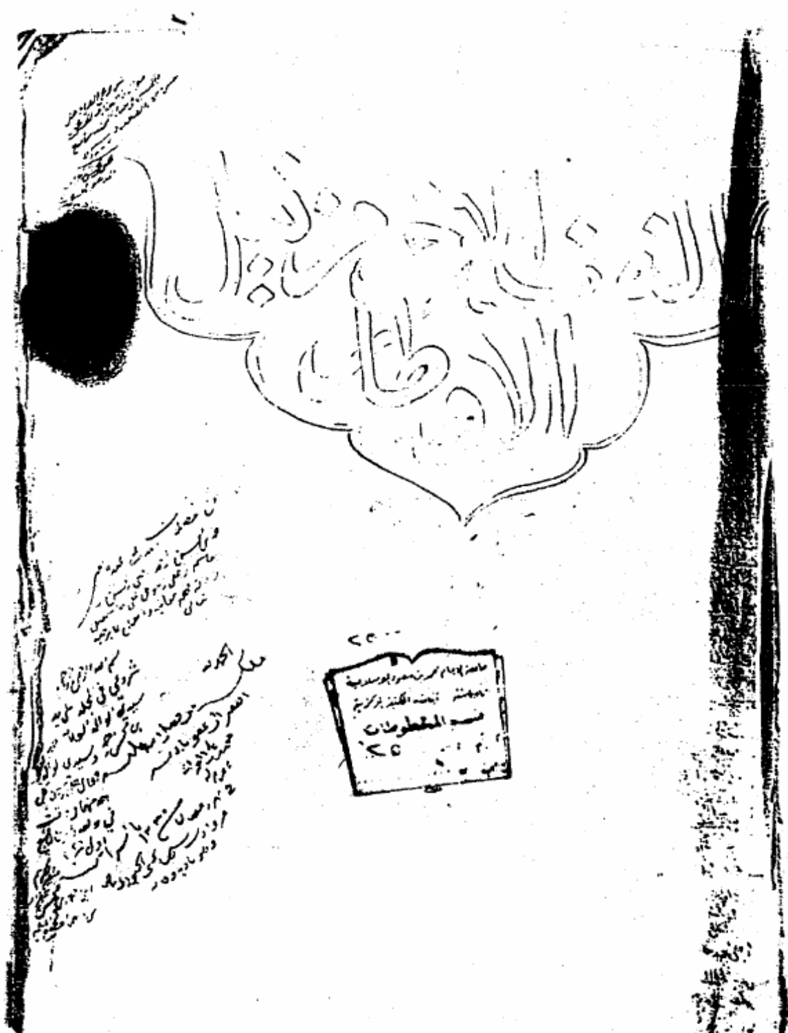
طرة النصف الثاني من الأصل