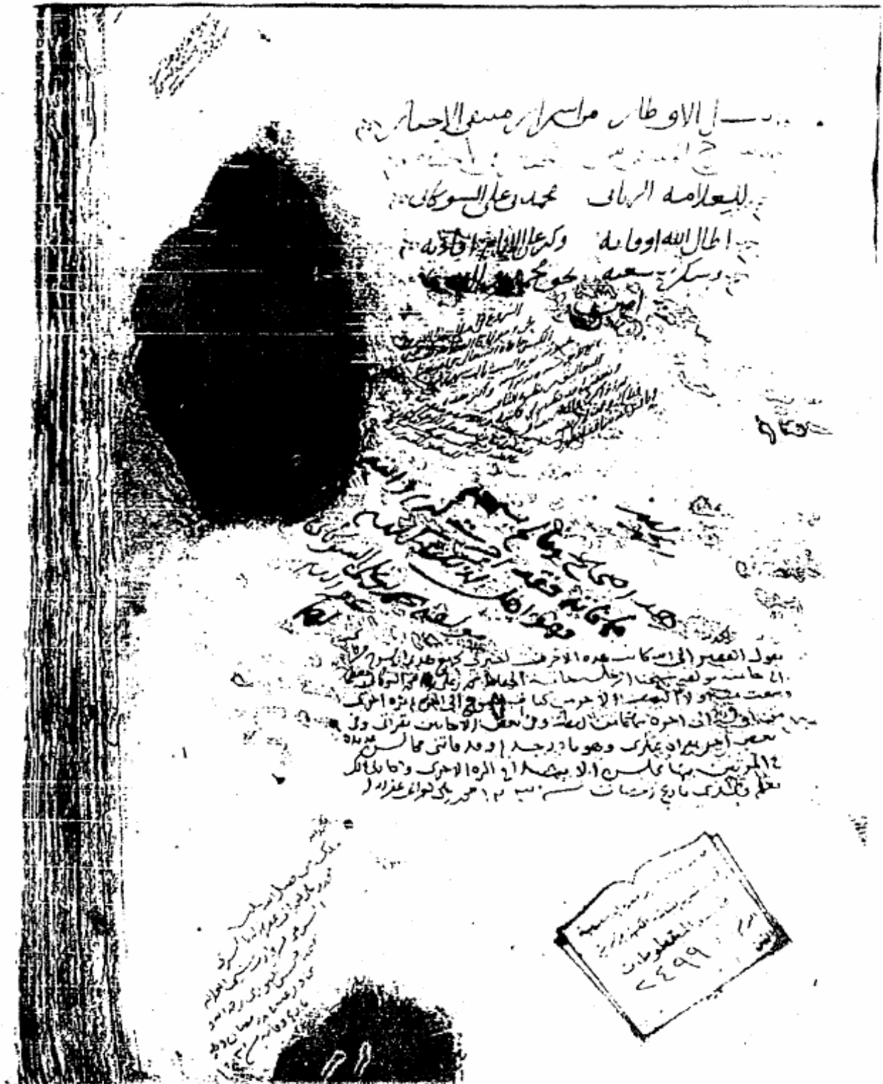
طرة النصف الأول من الأصل